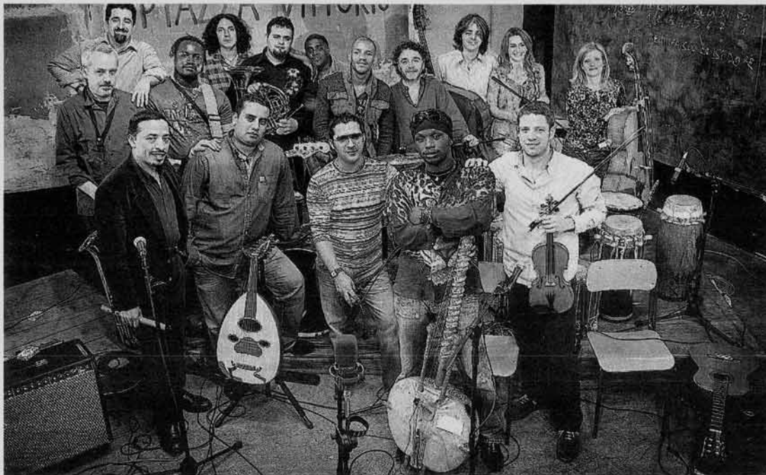
L'Orchestra di piazza Vittorio, anche loro presenti al Festival

La cultura abbatte le barriere. E così il teatro può entrare in carcere, la musica far dimenticare una sedia a rotelle, la comicità clownesca percorrere le corsie di un ospedale. A tutte le forme d'arte utilizzate per combattere il disagio (disabilità, malattia psichica, carceri e ospedali...) è dedicato Lo Spettacolo Fuori di Sé - Festival delle Eccellenze nel Sociale , kermesse fuori dai canoni, a cominciare dal luogo in cui si tiene - la prima volta in Italia - l'ospedale San Camillo Forlanini di Roma (13-15 dicembre, www.festiva-leccellenzenelsociale.it ). Artisti "diversi" e artisti che si battono per trasformare la diversità in ricchezza. Compagnie teatrali di persone con disabilità, come il Teatro della Ribalta di Bolzano che porta in scena l'orrore del programma di sterminio nazista T4. Rappresentazioni messe in scena da attori detenuti, come Expert , testo di Kafka rielaborato con contributi personali e portato in scena dalla compagnia del Due Palazzi di Padova. La musica rock "a rotelle" dei Ladri di Carrozze, quella multietnica dell'Orchestra di Piazza Vittorio e quella dei Presi per Caso, band costituita da detenuti ed ex detenuti. E poi cinema, un workshop di